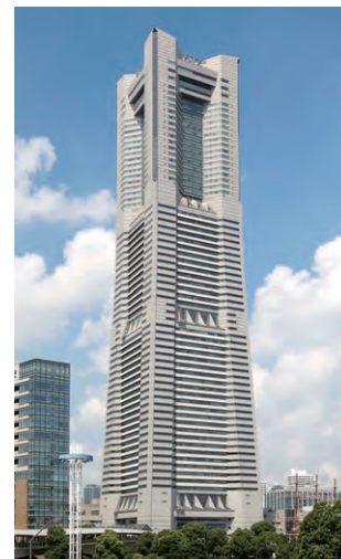
横浜ランドマークタワー 空調設備