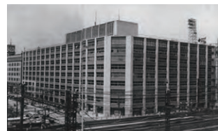
新大手町ビル 冷暖房設備