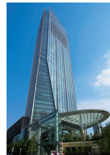
虎ノ門ビルズ 空調設備