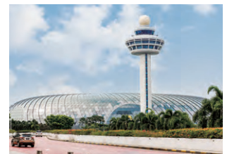
ジュエル・チャンギ・エアポート 空調換気設備(シンガポール)