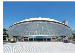
東京ドーム 空調設備