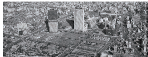
新宿副都心地域 地域冷暖房設備