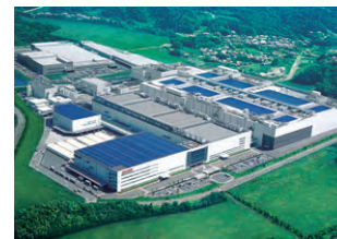
シャープ株式会社亀山工場 空調設備