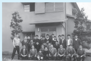
高松寮で研修する「花の1期生」