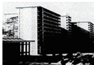
チョーライ病院 空調・衛生設備(ベトナム)