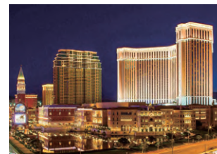
ザ・ヴェネチアン®・マカオ・リゾート・ホテル 空調・地域冷房設備(マカオ)