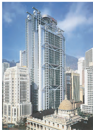
香港上海銀行本店ビル 空調・衛生・電気設備(香港)